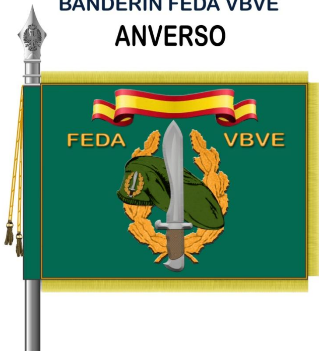
BANDERIN FEDA VBVE ANVERSO